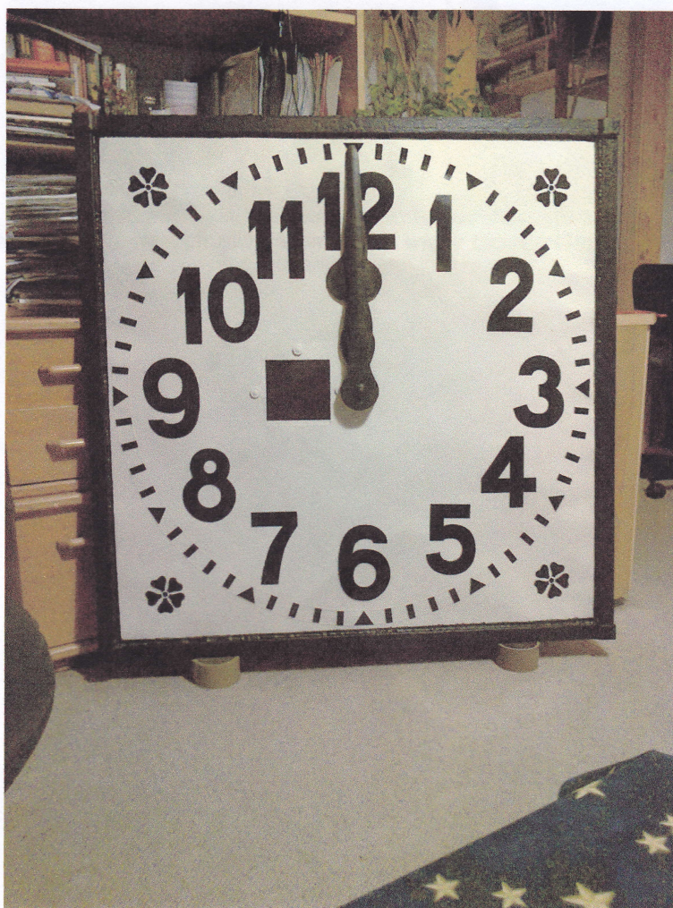
Jedna z dwóch tarcz zegarowych pomalowana farbami NOXYDE przygotowana do transportu na wieżę Urzędu Gminy w Nowym Warpnie