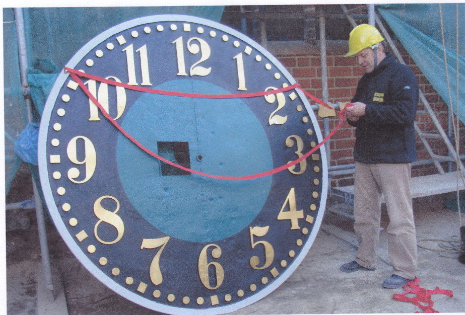
Jedna z trzech tarcz zegarowych pomalowana farbami NOXYDE przygotowana do wciągnięcia na wieżę kościoła p. w. św. Jana Chrzciciela w Myśliborzu