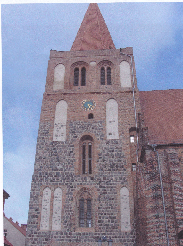
Tarcza zegarowa na elewacji południowej wieży kościoła p. w. św. Jana Chrzciciela w Myśliborzu