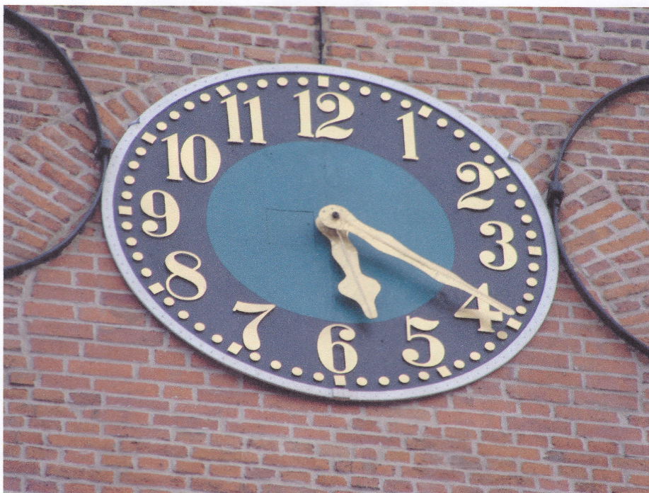
Tarcza zegarowa na elewacji zachodniej wieży kościoła p. w. św. Jana Chrzciciela w Myśliborzu