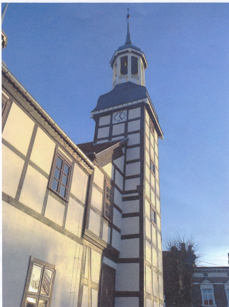
Jedna z dwóch tarcz zegarowych zamontowana na wieży Urzędu Gminy w Nowym Warpnie

Z powierzeniem A. Kozłowski Marszałek Sejmiku Powiatu 48-267-1007 ul. Świdzińska 100, 48-267-1007